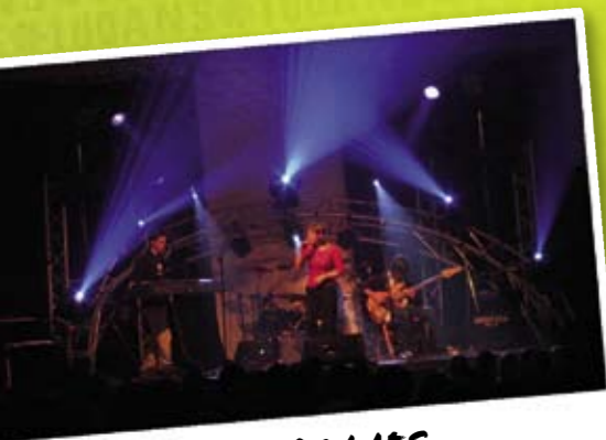
JACOFOLIES CONCERT PROFS-ÉLÈVES

Mais le clou, ce sont bien sûr les spectacles de la Fancy-Fair , dont la fameuse comédie musicale « Ulysse 87 » est restée dans les annales. Le succès fut tel que les jeunes artistes furent invités à donner une représentation complémentaire « en extérieur », au Palais des Congrès.