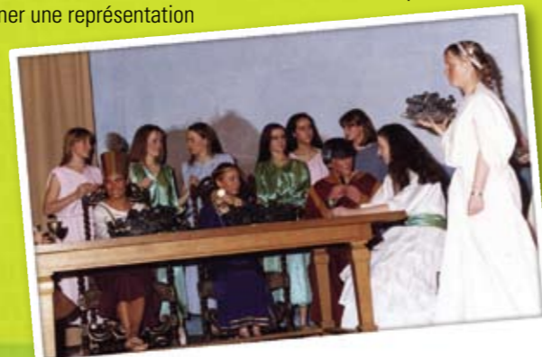
SPECTACLE « ULYSSE 87 »

C'est d'ailleurs de cette époque que date le concept tout particulier de ces spectacles : le projet germe d'abord dans la tête des rhétos qui prennent en charge toute l'organisation, en veillant à mettre sur scène le plus grand nombre d'élèves de tous âges, tout cela sous l'œil bienveillant et vigilant de quelques professeurs... De Cyrano aux Mille et une Nuits , en passant par Rimbaud , Agatha Christie ou les chefs d'œuvre du cinéma, ils revisitent leurs classiques avec poésie, impertinence et talent !