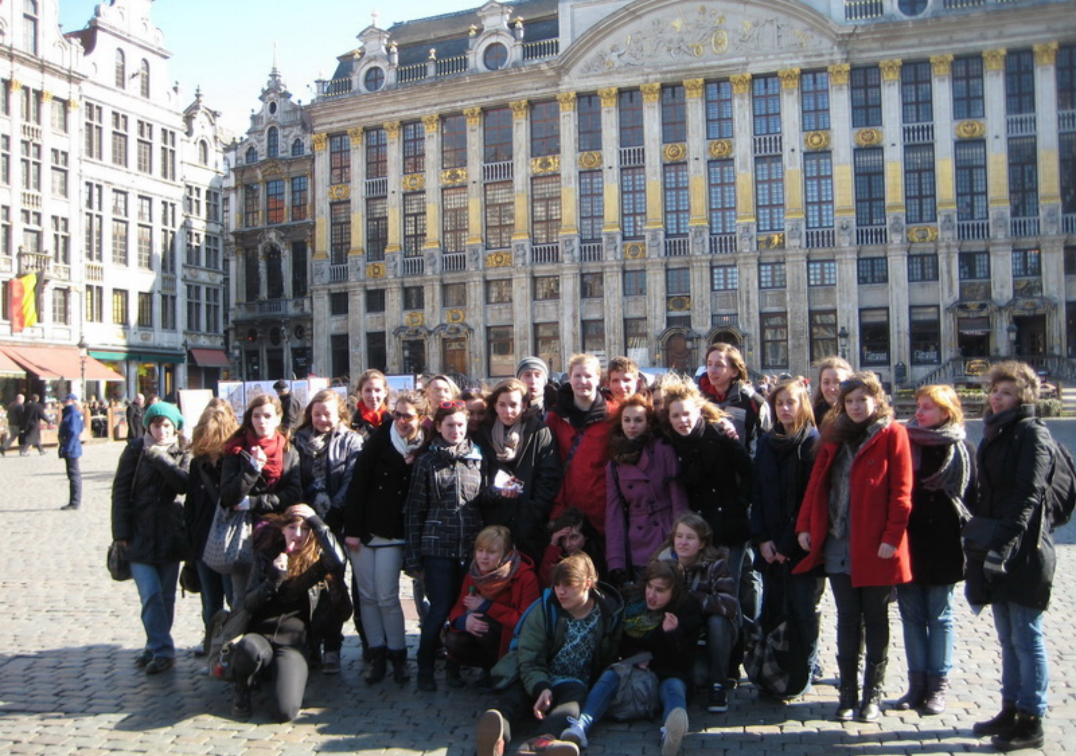
Bruxelles, la Grand Place